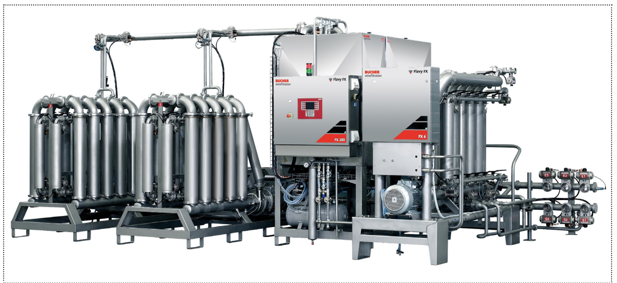
Flavy FX Tandem