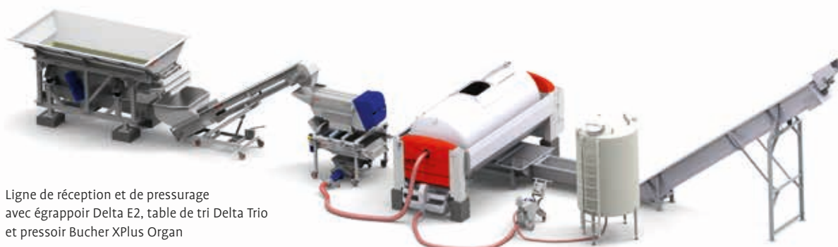
Ligne de réception et de pressurage avec égrappoir Delta E2, table de tri Delta Trio et presseur Bucher XPlus Organ