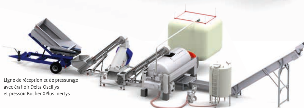
Ligne de réception et de pressurage avec éraffoir Delta Oscillys et presseur Bucher XPlus Inertys