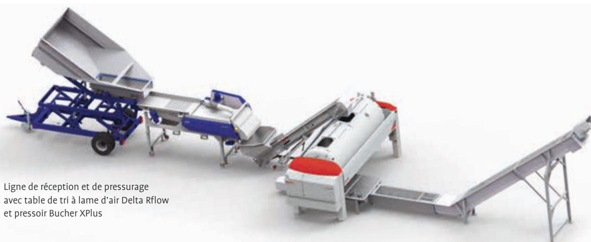
Ligne de réception et de pressurage avec table de tri à lame d'air Delta Rflow et presseur Bucher XPlus

Tous les équipements de la gamme Delta ont été conçus pour respecter la baie de raisin dans un souci constant de sécurité garantie pour l'utilisateur, d'hygiène et de nettoyage simplifié.