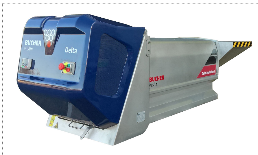
Delta Evolution 2